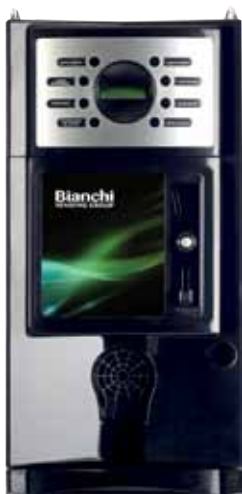
GAIA MIT KIT MÜNZENWURF